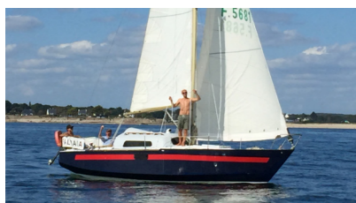
FALBALA Armagnac ROBIANO DE SAFFRAN (de) Alain