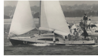
POCLETTE Surprise PIRIOU Florence-Marie