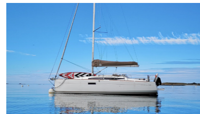
LOUKOUM Sun Odyssey 349 QR BAILLOT Gilles