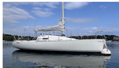
ALOHA Figaro 1 Dourlen Pascal