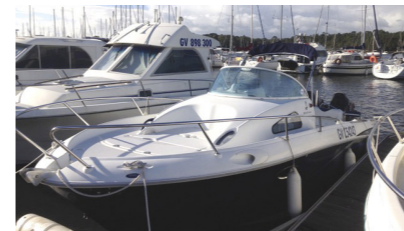
SALVADORA III Flyer 7,5 VINCENSINI Anne-Marie & Charles