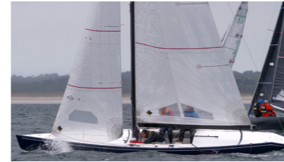
AUGUSTE IER 5.5 m JI JAUEN Gurvan