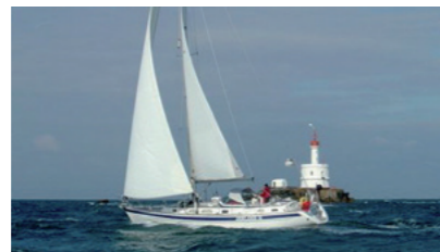
JASLAND II Hallberg Rassy 43 GHICLIA Bernard