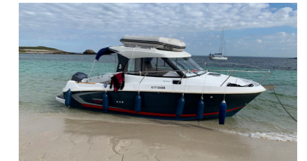
GWENN HEOL IV Antarès LE GENTIL Florence