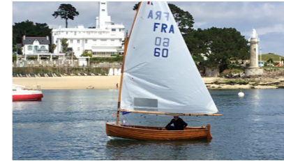
PICCOLINA Dinghy 12 de PENFENTENYO Hughes