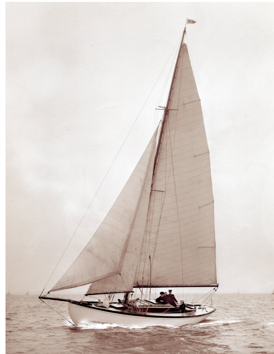
Andante II, 1948 - © Beken