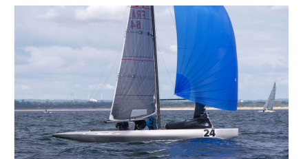
SILVER FOX 5,5 m II DATRY Jean-Bernard