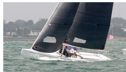
ENEZ C'LAS I 5,5 m JI YCO