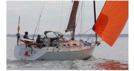
SALSA Gib Sea 302 LE GALL Jacques