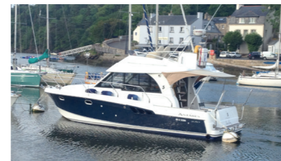
CHASSE SPLEEN Antares 9.80 LE GOFF Erwan