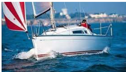
VA ZI BIHAN Sun Fast 26 ROUDAUT René