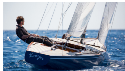
KORRIGAN 5,5 m II JAOUEN Gurvan