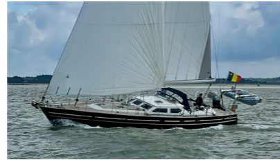
SURCOUF Contest 55CS ROUFFART Edmond