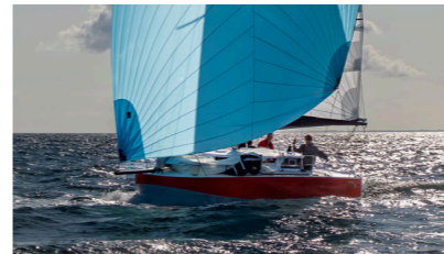
LAMB-UN Mojito 650 AUGEREAU Bertrand