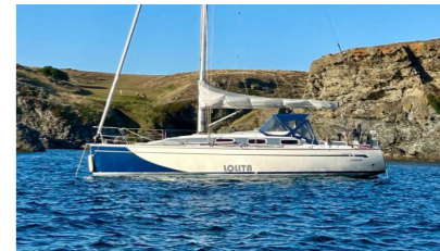
LOLITA Bavaria 35 match BOURHIS Frédéric