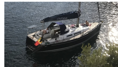
LOVITANA Grand soleil 37 VANDENBERGHE Frédéric