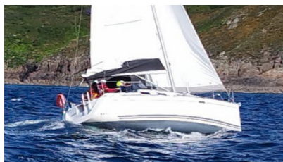
EMGANN Dufour 325 BATAILLE Benoît