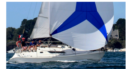
CAP'TY'VENT Sun Odyssey 28.1 Darguesse Jean-Luc