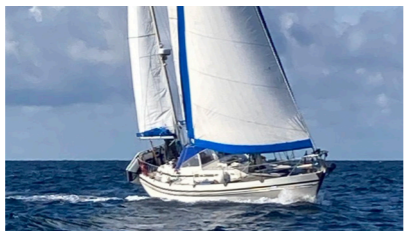
AMZERI VIII Contest 40 de PARSCAU Paul