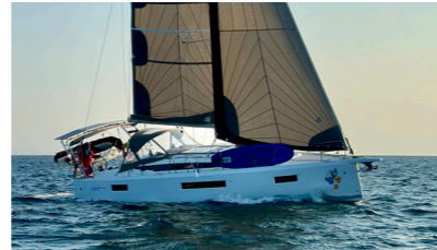
DONALD DUCK Sun Odyssey 410 QR MASSOT Alain