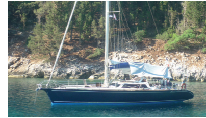
PICASO Vaton 14m PICARD Jérôme