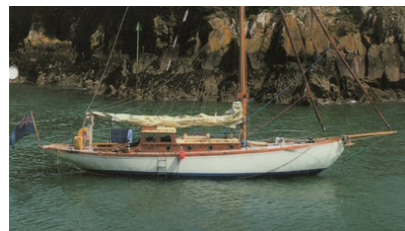
ANDANTE Plan Dallimore 1936 LLOYD Michael