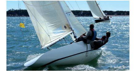
BAGHEERA VIII 5.5 JI DATRY Jean Bernard