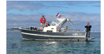
GRIBOUILLE RHÉA 7.5 Open de PENFENTENYO Hugues