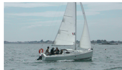
MEDIA LUNA Etap 21 i DUQUE Caridad & Richard