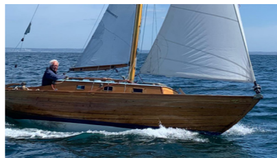
AMBER Folkboat GOUZE Dominique