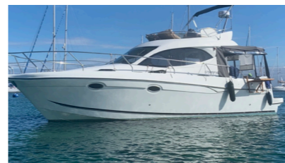
MAXIM Vedette GOURMELIN Valérie