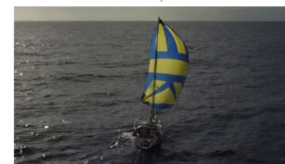
HARMATTAN Sun Odyssey de LA ROCHEFOUCAULD Tugdual et Omblin