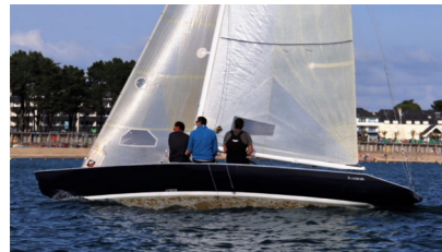
IN EXTREMIS 5,5m II YCO