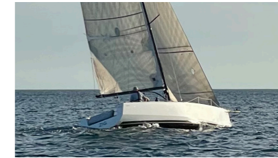
ZIG Optio 30 LECERF Jean-Yves