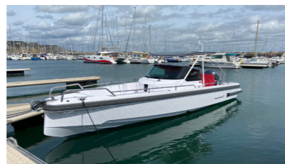
VIKING Ayopar 28 de SAINT PIERRE Hervé