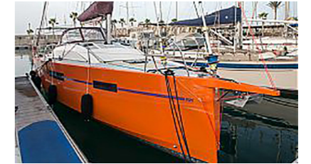
PIMENT BLEU LACHOT Frederic