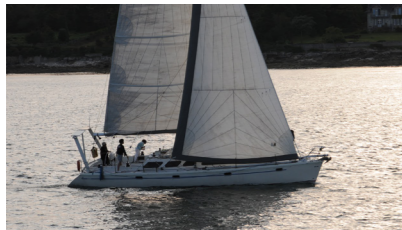
DRACÈNE Sadler 45 HÉMON Arnaud